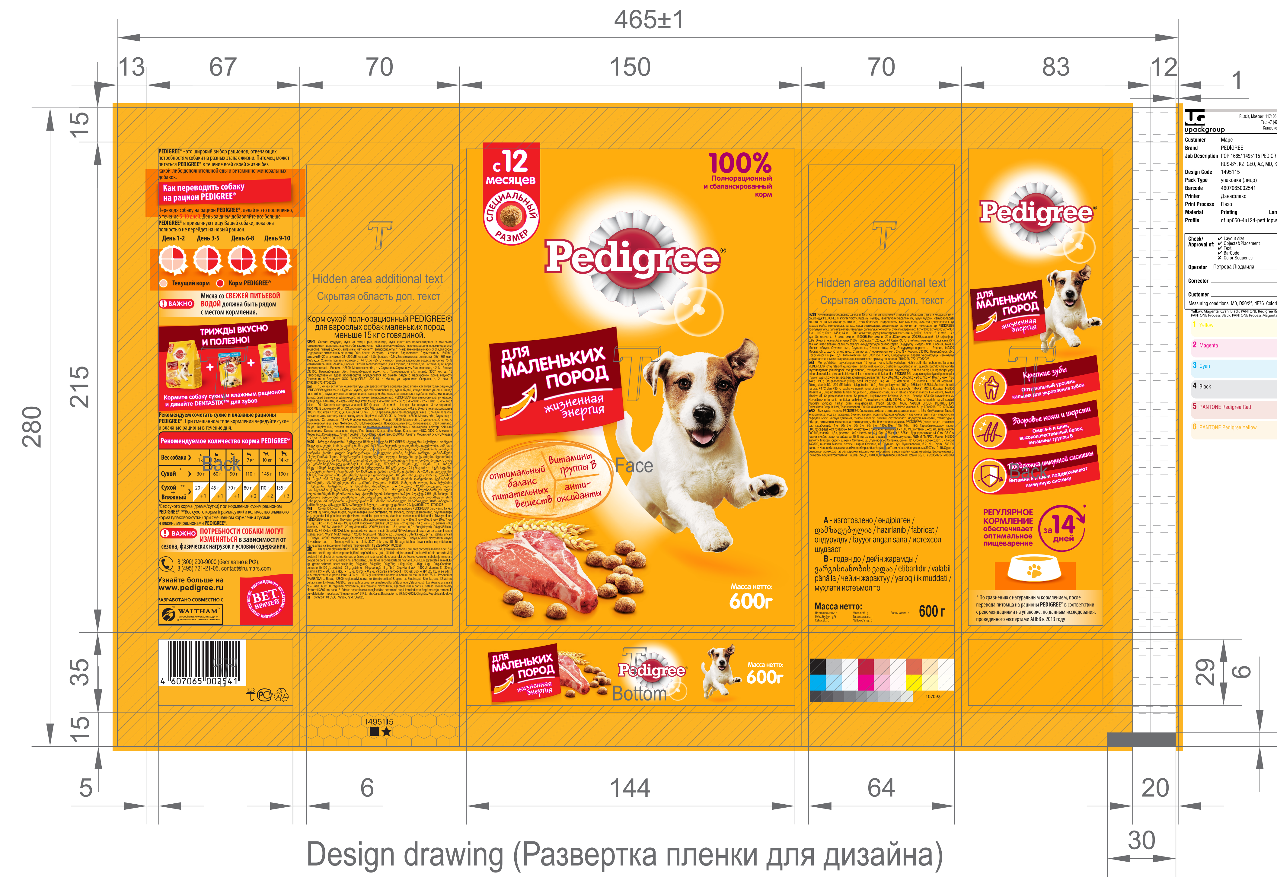
Design drawing (Развертка пленки для дизайна)